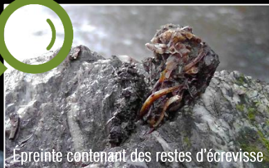
Epreinte contenant des restes d'écrevisse